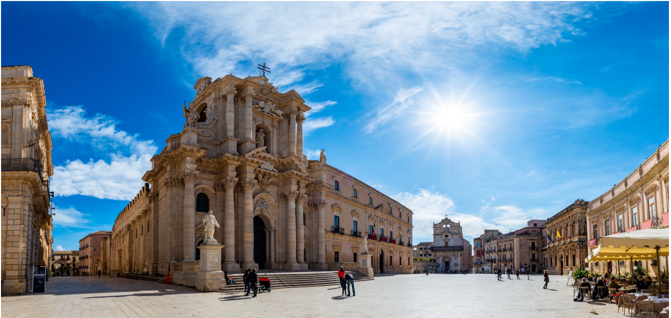
Die Piazza Duomo in Syrakus mit der Kathedrale, im Hintergrund die Kirche Santa Lucia alla Badia.

Als „die größte und schönste aller griechischen Städte“ lobte Marcus Tullius Cicero die an der Ostküste Siziliens gelegene Stadt Syrakus. Um 730 v. Chr. landeten hier aus dem griechischen Korinth angereiste Siedler und gründeten die Stadt. Von der heutigen Altstadt aus, die auf einer 40 ha großen Insel liegt, wuchs Syrakus rasch bis aufs Festland und war bald schon die größte und prosperierendste Stadt Siziliens. Am Tyrannenhof wirkten bedeutende Gelehrte: die Dichter Aischylos, Pindar, Bakchylides und Simonides, der Philosoph Platon und der Physiker Archimedes. Im Zuge ihres Bestrebens, die Vorherrschaft im Mittelmeerraum zu übernehmen, gelang den Römern 212 v. Chr. im Zweiten Punischen Krieg die Eroberung von Syrakus. Nach dem Ende der Römerherrschaft fiel die Stadt an zahlreiche Machthaber: 439 an die Vandalen, 493 an die Ostgoten, 535 ans Oströmische Reich, 878 an die Araber, 1038 an Byzanz, 1086 an die Normannen, 1221 an die Staufer, in den folgenden Jahrhunderten an Anjou, Aragon, Savoyen, die Habsburger und die spanischen Bourbonen. Nach einem verheerenden Erdbeben im Jahr 1693 erfolgte der Wiederaufbau in Formen des Barock.