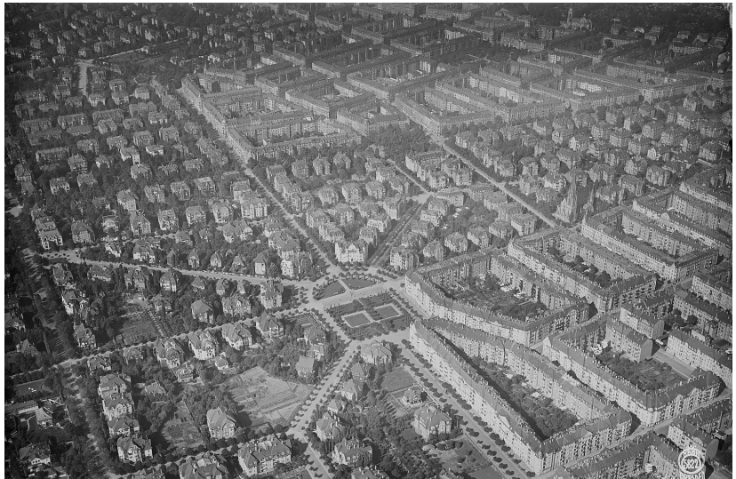
Dresden Striesen, Walderseepark (Stresemannplatz), 1924.