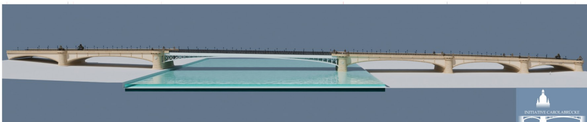
Zeichnung: Rainer Grötzschel, Maßstab 1:400, ohne Statik-Nachweis, Dampfer "Dresden" als Größenbezug Visualisierung: Maximilian Georg Liebscher