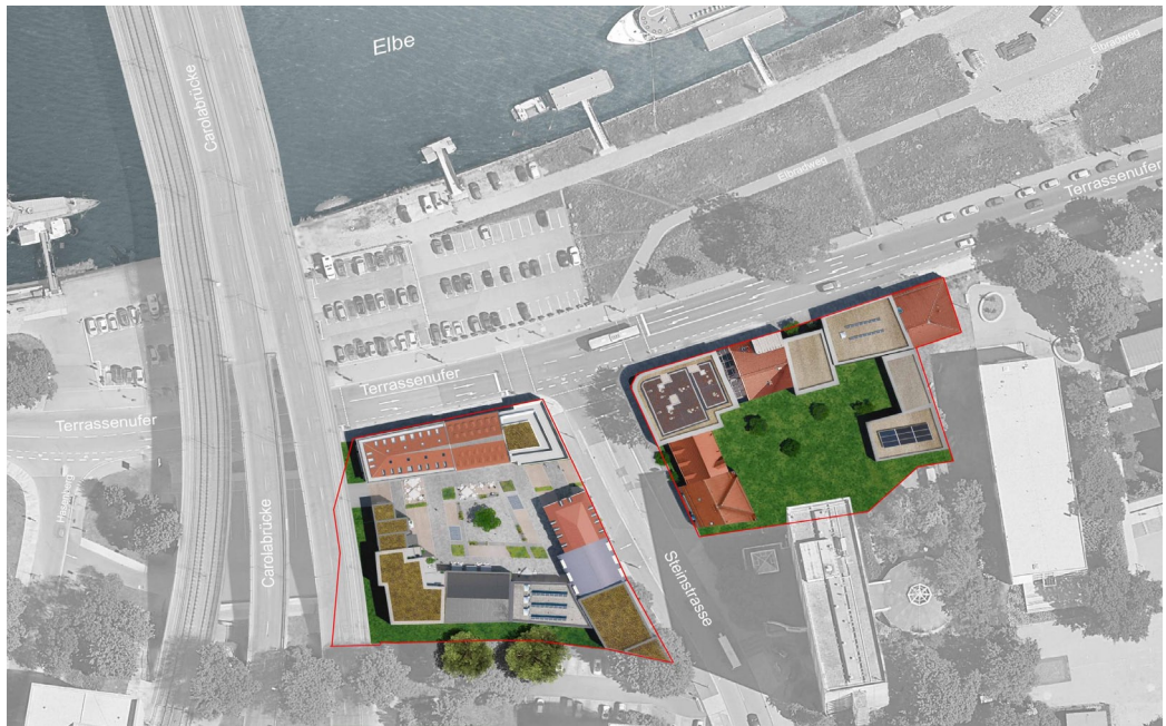
Zwei neue Quartiere könnten an der Carolabrücke entstehen.

in der Nähe der Carolabrücke noch mit der Grundstücksnummer 1008 im Grundstückskataster ausgewiesen. Bothen gilt als einer der bedeutendsten Architekten des 19. Jahrhunderts in Dresden. Als Zeitgenosse Gottfried Sempers entstanden aus seiner Hand bedeutende Bauwerke in Dresden.